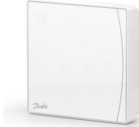
Danfoss Icon2™ Sensor 088U2120