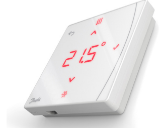
Danfoss Icon2™ Featured RT (IR sensor) 088U2122

A Danfoss Icon2™ RT vezeték nélküli termosztátok, amelyek elhelyezését nem korlátozzák falban futó vezetékek. A minimalista kialakítású, mindössze 16 mm mélységű, elegáns megjelenésű elsötétülő kijelzős készülék beleolvad a környezetébe.