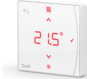
Danfoss Icon2™ RT 088U2121