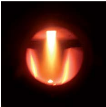
A speciális kerámia tüztér működés közben